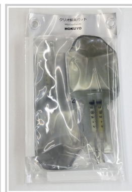
シリンジセット 2 組まで収容