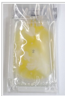
クリオ製剤 2 本まで収容