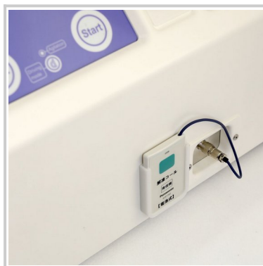
送信機（解凍器と接続）